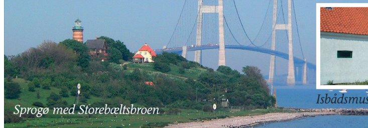
Sprogø med Storebæltsbroen