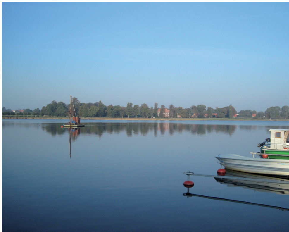
Udsigt fra Præstø havn mod Nysø